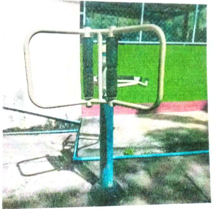
เครื่องออกกำลังกายกลางแจ้ง