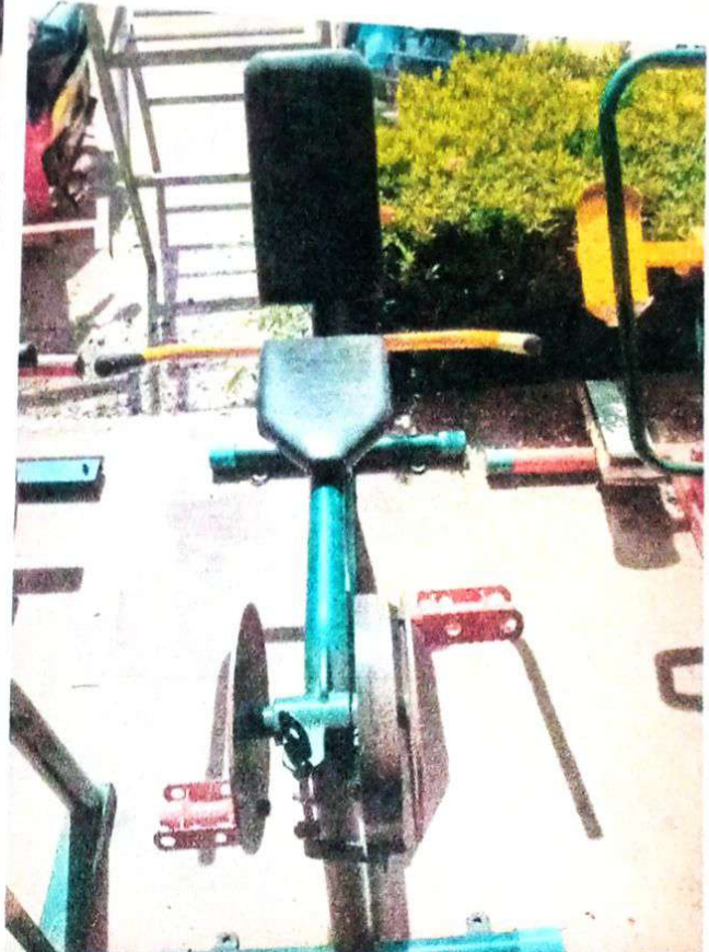
อุปกรณ์ออกกำลังกาย