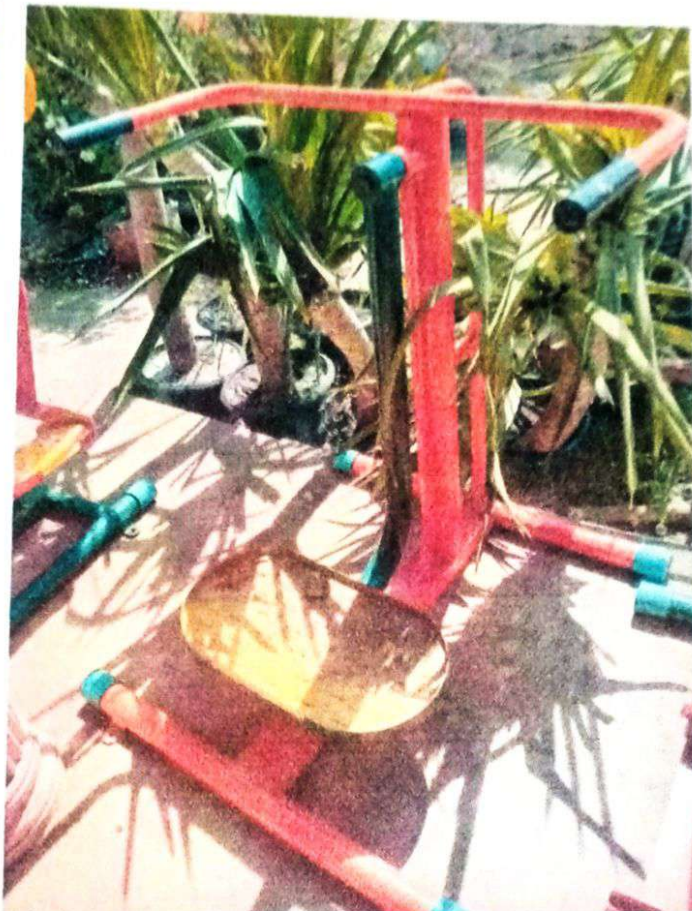
อุปกรณ์ออกกำลังกาย